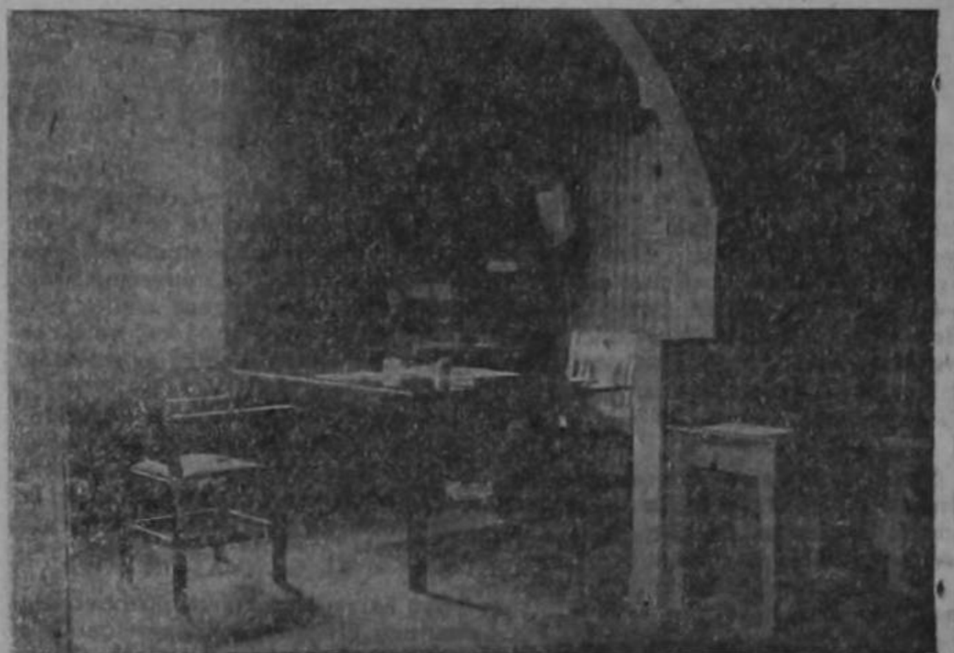
Salas de Administración y Redacción de LA TARDE y LA MANANA