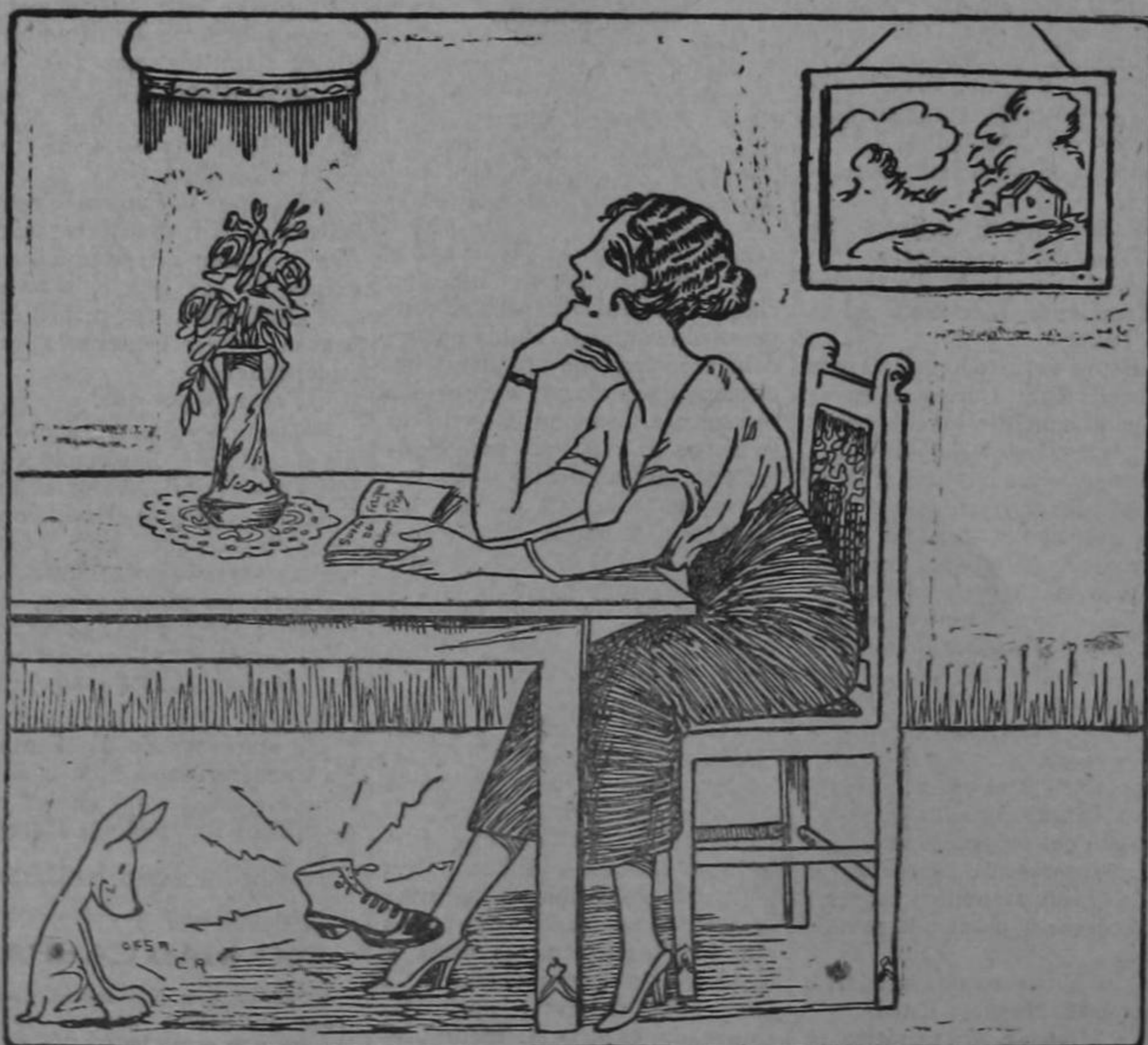
Una dulce ilusión...

Señoras y señoritas: Acaban de llegar preciosos vestidos de seda para baile. Abrigos, Capas, Bolsos de fantasía. Encajes de gran novedad. «Al Siglo Nuevo» A. Herrero & C o