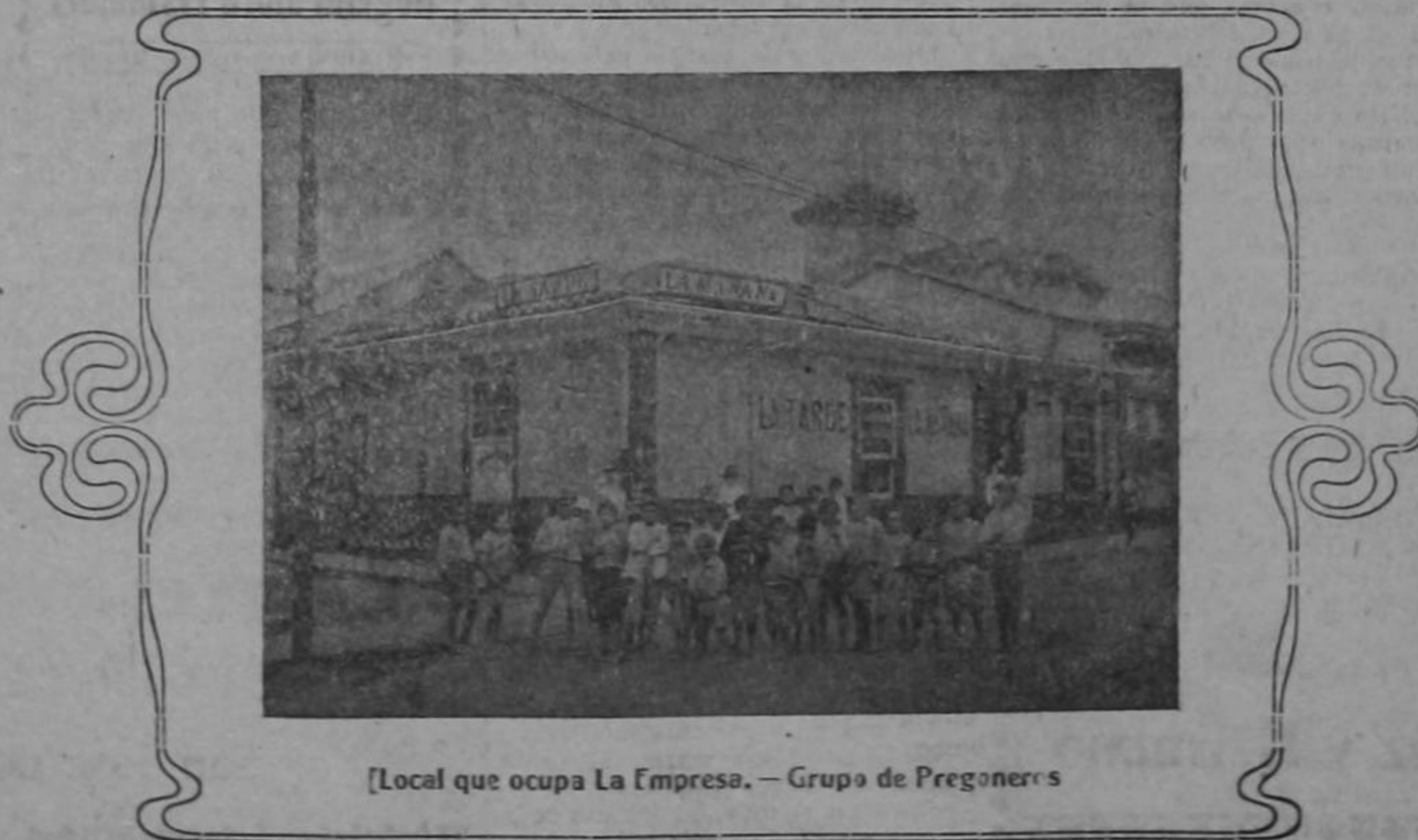
[Local que ocupa La Empresa. — Grupo de Pregoneros

El vapor que trajo a Costa Rica a los señores deportados peruanos tocó recientemente en el Callao, con serias averías en la máquina a consecuencia de haber sido recargado pues es capaz de contener solamente tres mil toneladas y llevaba un exceso considerable. Se rumora, no sabemos porqué, que el capitán será castigado con su oficialidad por los sucesos ocurridos a raíz de la expulsión de los ciudada-